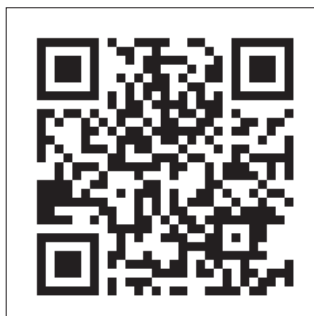
ノースアジア大学オープンキャンパス公式